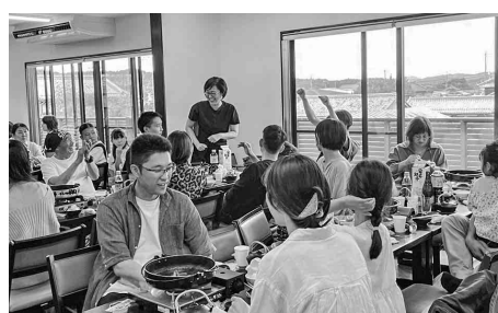
みんなで楽しくじゃんけん大会

天候に恵まれない中にも かわらず、多くの方にご 参加いただき、「楽しかつ た」「また参加したい」と の声を多数頂戴しました。 地域の皆様との交流を深 める貴重な機会となりまし た。