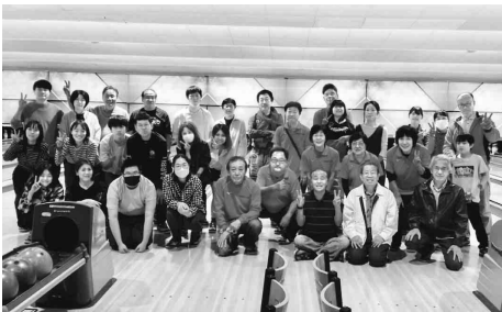
ボウリング大会に参加した皆さん

十月十九日(日)中川コ ロナワールドにおきまし て、中川熱田支部「秋の大 ボウリング大会」と題して、 支部レクを行いました。 大会に臨むにあたり、景 品を楽しみに参加される方 やボウリングの経験の無い お子様の為に事前に練習に 励まれ参加された方、何十 年ぶりにボウリングをされ る方等、日頃、建設職人を支 えていただいている主婦層 を始め、小学生のご家族を ボウリング流行時によく