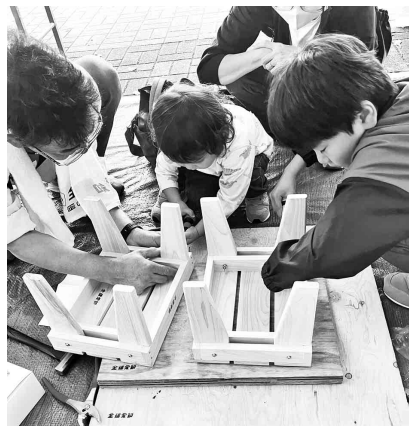
みんなで楽しくイスづくり

十月十八日(土)・十九日 (日)の二日間、春日井まつ りに全建愛知春日井支部とし て参加し、恒例の「イスづく り」体験を行いました。