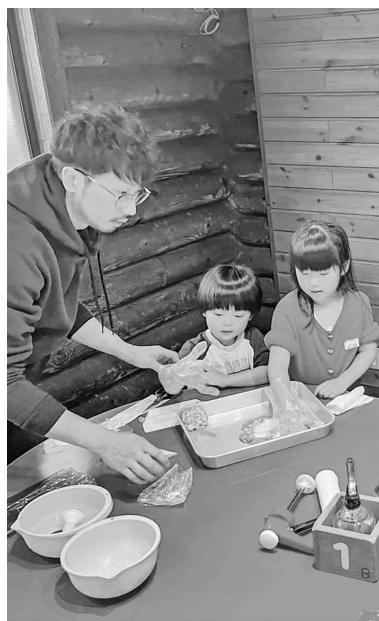
子供達とワインナー作り体験(青年部レク)

ふとした時に友人から組合の活動の事を知り、なんとなく支部の活動をしていくうちに色々な人と知り合いになりました。職人の方達との繋がりが増え、仕事