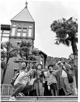
参加者で記念撮影

今回十五周 年記念レクで 一泊二日の旅 行となりました。 二十五日、 USJでは参 加者が各々楽