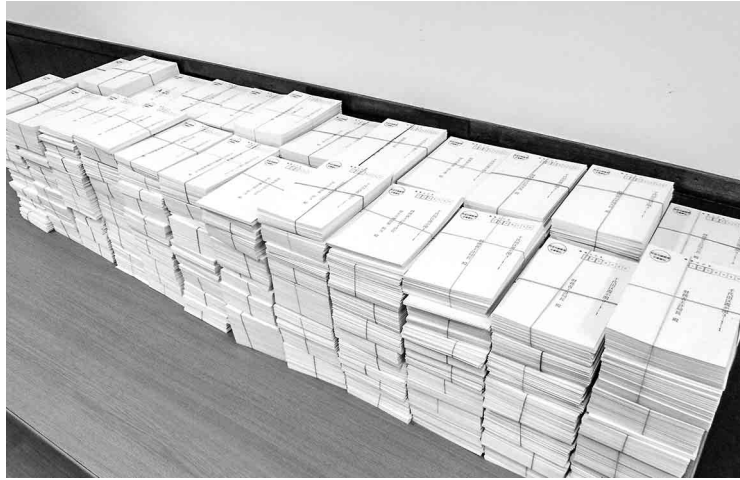
集約された30,953枚のハガキ

二〇二六年度 概算要求額 二〇二六(令和八)年度 国保組合関係予算の概算要求額は、総額二千六百七十七億円、二〇二五年度当初予算比で六十一億円の増額で、要求となりを求められ、削減が厳しく求められ、裁量的経費において、高額医療費共同事業補助金で一億五千万円増の四十二億五千万円、事務費負担金で新