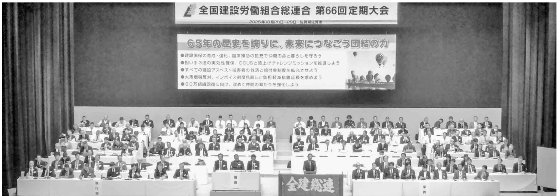
全国52県連・組合から1,108名の仲間が集結