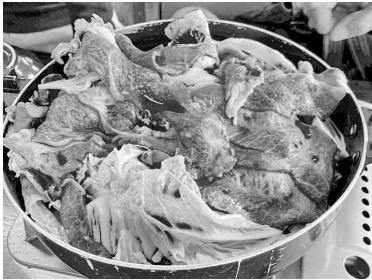
近江牛のすき焼き

存分に味わい、会場では じゃんけん大会を開催し参 加者の皆さんの盛り上がり と笑顔があふれていまし た。