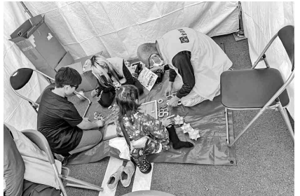
木のパズルで遊ぶ参加者

おみえになられた方のお 父様が生前大工さんで全建 愛知に加入してたから、懐 かしいと言われました。