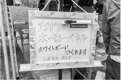
ホワイトボード工作の案内板