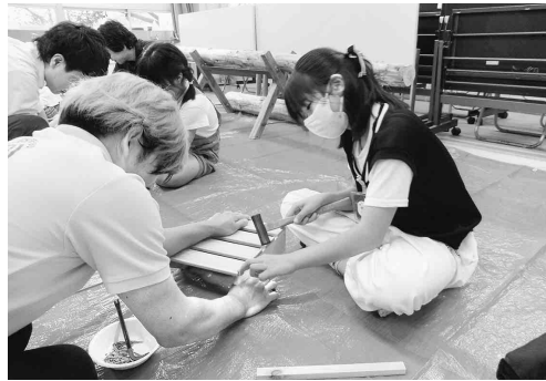
あと少しで完成だあ

九月十二日(火)名古屋市長立原小学校で匠の体験、モノづくり講座を開催しました。当初の予定では七名の児童が参加でしたが、体調不良のため、三名欠席で四名の児童が参加してくれました。