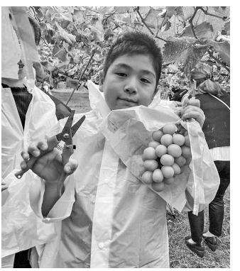
シャインマスカットだよ。大き持ち帰って食べた味は格別でした。風食は、風神温泉「ユルイの宿恵山」にて信州郷土の会席料理をいただいた。お腹いっぱいになった後は、風神温泉

十月八日(日) 昭和中支部主婦の会は、バス二台総勢六十五名で長野県へシャインマスカット狩りと風神温泉へ行きました。途中、道の駅 信濃路下