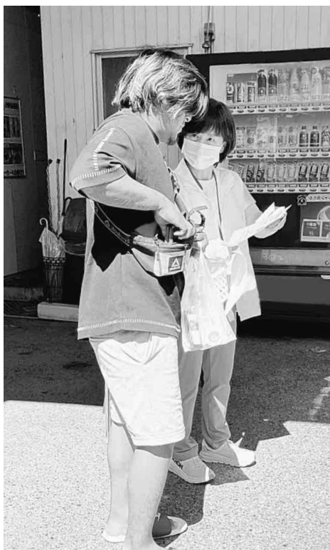
職人さんへ声掛けをする役員(奥)【一宮支部】