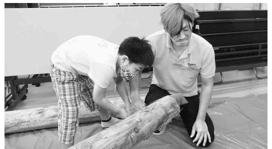
ヨイショヨイショ

さんや丸太切りの体験、カンナがけ体験、継手・仕口模型体験を行いました。太を切り、カンナで角材を削り、継手・仕口模型では児童と先生方も一緒に体験してもらい、カンナくずで遊ぶ子もいました。