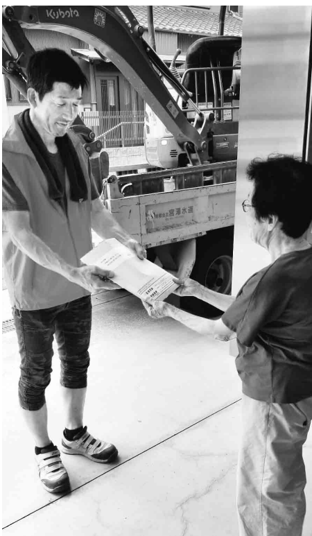
組合員宅を訪問する役員(左)【名東支部】

秋の組織拡大強化月間に伴い、各支部では趣向を凝らした組織拡大行動が実施されています。特色を活かした取り組みの中から、「名東支部」と「一宮支部」の二支部にスポットを当て組織拡大行動を報告いたします。