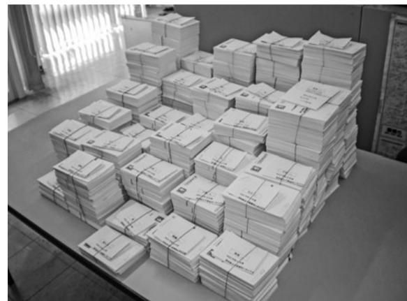
昨年秋、皆さんにお書きいただいたハガキ