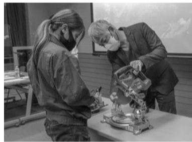
丸のこ特別教育の様子

「丸のこ等取り扱い作業従事者特別教育」は、建設キャリアアップシステムにおいて、建築大工・型枠・内装仕上で登録する方が、中堅技能者に当たるレベル 2を取得する上で必要な資格となります。この機会にぜひ受講ください。 ■開催日時 四月二十五日（火）