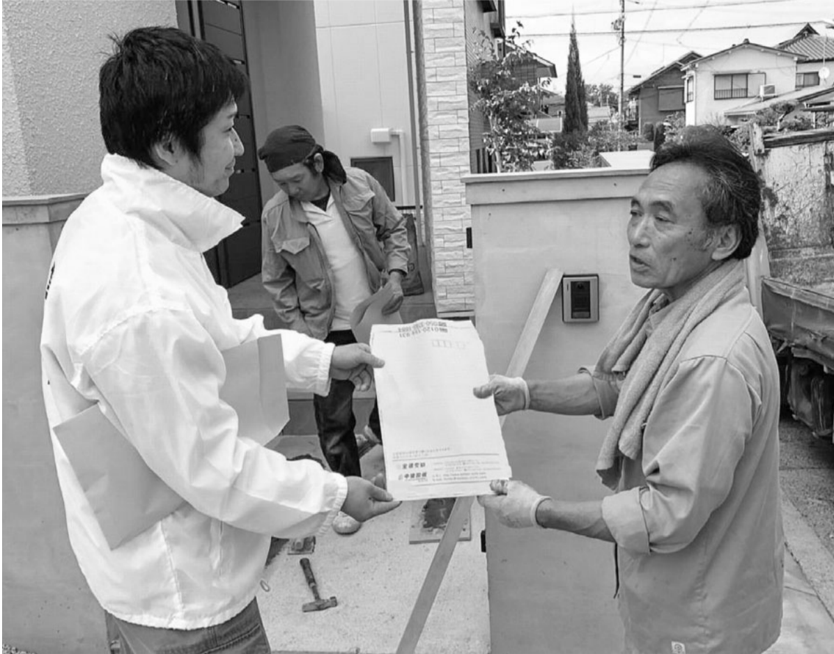
建設現場へ訪問し組合PRをする千種支部役員(左)(2018年10月13日実施)

全建愛知 全愛知建設労働組合 〒455-0008 愛知県名古屋港区九番町4-1-10 ☎ (052)659-0288 FAX (052)653-0181 ☎ 0120-154-931 ☎ 050-3785-1684 E-mail: honbu@zenken-aichi.com