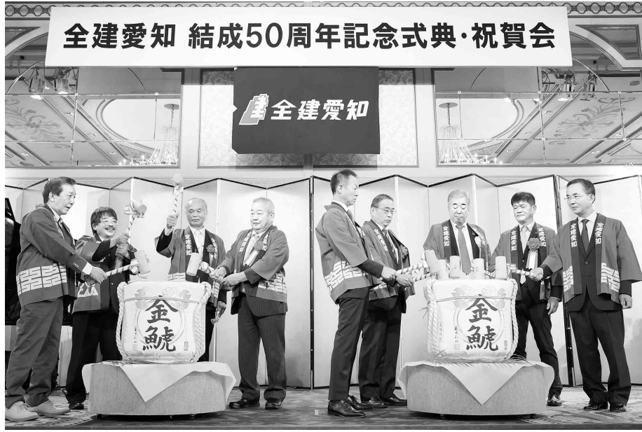
全建愛知 結成50周年記念式典・祝賀会

の登録件数は着実に前進しています。政策的課題は山積しておりますが、CCUSの普及促進に向けて、官民一体となり、更に取り組みを強化・加速化させたいと考えております。全建総連として、全国五十三の加盟組合のフロントランナーである全建愛知と連携を密に、物価上昇を上回る大幅な賃金・単価引き上げ、技能者の処遇改善と担い手確保・育成、そして魅力ある建設産業の実現を目指して、全力で取り組んで参ります。