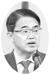
愛知県知事 大村 秀章

全建愛知とは、私が国会議員時代、社会保障や国庫補助などで一緒に仕事をさせていただきました。建設産業に従事する皆様にとって健康が一番の基本でありますので、引き続き国庫事業を中核として活動を進めていただきたいと思います。愛知県との間では、災害時における被災住宅の応急修理に関する協定・応急仮設住宅建設に関する協定を結ばせていただいております。災害対応についてもご協力いただいております。引き続き皆様の卓越なる技術・技能を大きく期待しております。