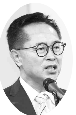
国民民主党 愛知県総支部連合会 代表 衆議院議員 古川 元久

建設業は経済の発展において欠かせないです。しかし、資材の高騰など、建設業を取り巻く状況は大変厳しい状況です。インボイスも中小個人事業主において冷徹な政策です。政治は、いったい何のためにあるのか。私たち立憲民主党は、働く立場の皆さん・生活者の皆さんの暮らし・所得・賃金が上がる社会にするため、政治に取り組んでいきたいです。