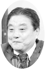
名古屋市長 河村 たかし

全建愛知とは、私が国会議員時代、社会保障や国庫補助などで一緒に仕事をさせていただきました。建設産業に従事する皆様にとって健康が一番の基本でありますので、引き続き国庫事業を中核として活動を進めていただきたいと思います。愛知県との間では、災害時における被災住宅の応急修理に関する協定・応急仮設住宅建設に関する協定を結ばせていただいております。災害対応についてもご協力いただいております。引き続き皆様の卓越なる技術・技能を大きく期待しております。