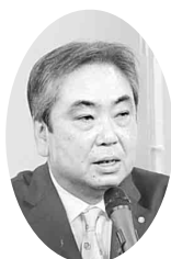
名古屋市長 河村 たかし

私たち新政あいち県議団と全建愛知の役員の方々と毎年、意見交換をさせていただいています。この良好な関係が本日をもって更にもっと関係になると、確信させてくださいました。この組合がより一層発展していただくことを祈念いたします。