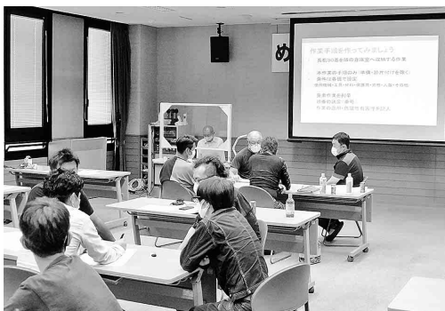
職長・安全教育講習の様子

作業中の労働者を直接指導または監督する者(作業主任者を除く)は、作業の方法および労働者の配置または監督の方法、安全衛生