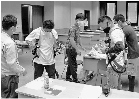
フルハーネス特別教育の様子

平成三十年六月十九日、労働安全衛生規則の改正により、高所作業を行う場合には、原則として平成三十一年二月一日から、フルハーネス型墜落制止用器具(安全带)を使用すると共に、高さが二メートル以上の箇所において、作業床を設けることが困難な場合で、フルハーネス型を使用して行う作業(ロープ高所作業を除く)を行う場合に