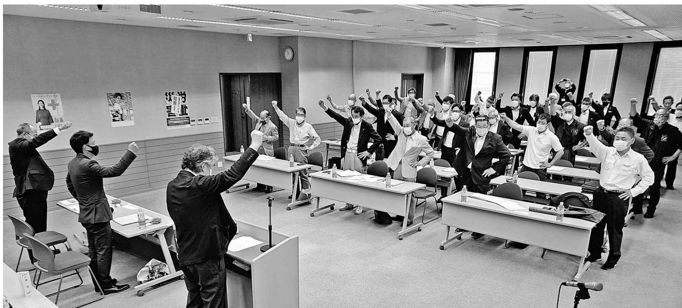
運動方針実現のため、団結ガンバロー