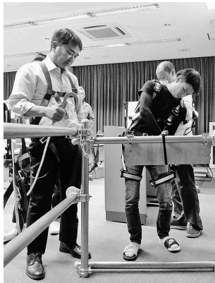
以前のフルハーネス教育の様子

組合では、この業務に従事する者を対象とする特別教育を下記のとおり開催することといたしました。この機会に是非