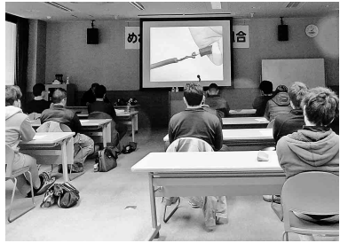
以前開催した丸のこ教育

において、建築大工・型枠大工・内装仕上職で登録する方が、中堅技能者に当たるレベル2を取得する上で必要な資格となります。これまで何十年と経験を積んできたベテラン職人であってもこの資格がないとレベル2を取得できません。また、入職したての若い職人が今後ステップアップするために必要な資格となります。ひとつでも上のレベル